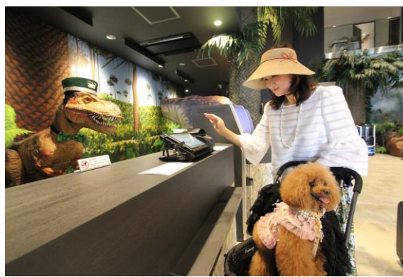
▲変なホテル「ドッグルーム」