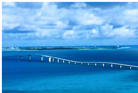
▲宮古島/伊良部大橋 (イメージ)

国内旅行は沖縄本島が1位になりました。冬の季節でも暖かく過ごせるリゾート地であることから、かぞく旅行、カップルなど旅行形態も多種多様となっております。年々、年末年始にカウントダウンイベントを行う地域・テーマパークが増えており、各地域で花火大会やスペシャルライブを楽しみにされている方も多くいらっしゃいます。