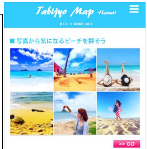
▲Tabijyo Map Hawaii(イメージ)

（※1）エコキャブ ビーチ・シャトル詳細はこちら http://bit.ly/hnlbch_hisact