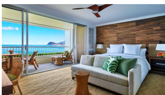
▲夏旅ホテル総選挙 2016 第 1 位：フォーシーズンズ リゾート オアフ アット コオリナ(イメージ)

【6/21～30 に新規オンライン予約される方限定】1 位を記念して特別割引クーポン登場！ 首都圏発着 ホノルル航空券と「フォーシーズンズ リゾート オアフ アット コオリナ」の同時オンライン予約で 1 万円引(1 グループ)！ クーポンコード：FSHT75P5JJZUGK38 詳細・予約はこちらから>> http://bit.ly/snshotel2016_his