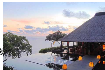
▲女性人気 No.1 ブルガリホテル(イメージ)

アジアビーチを代表するバリ島はエリア毎に特徴が異なり、大型ホテルが建ち並び計画的にリゾート開発されたヌサドゥア地区、大型高級リゾートが集まり、海辺にはシーフードバーベキューの屋台が並ぶジンバラン地区といったビーチエリアの他、緑豊かな田園風景と渓谷美が広がるウブド地区など、エリアによって様々な滞在スタイルを楽しむ事ができます。そのため、一緒に旅行する相手や予算など、旅行形態によってエリアやホテルの選択肢が多いことも魅力の一つです。ホテル数も多く、物価も比較的に安いことから他国のビーチリゾートに比べ、同予算で豪華ホテルに泊まる事も可能です。