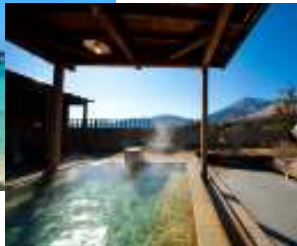
(大分温泉 イメージ)