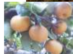
(果物狩り イメージ)

5連休ということもあり、日帰りはもちろん、1泊2日でも気軽に行けるお得感のあるコースが上位を占めております。バスツアーは通常出発の2週間前後がご予約のピークとなります。また前日まで予約が可能のため間際での増加も見込まれますが、シルバーウィークにおいては、現時点ではいずれの日付であっても空席があるものの、ご予約時期が早まっている傾向にあります。