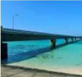
(大分温泉 イメージ)

シルバーウィークもファミリーに人気のまだまだ泳げる沖縄や、紅葉を迎える北海道が好調に推移しております。世界遺産で注目されている九州エリアの伸びが目立っており、レンタカーを利用した九州周遊コースが人気となっております。5連休を利用した旅行は、どの方面も非常に混み合っているのが現状ですが18日（金）出発や、22日（火）出発など前後に日付を調整することでご出発可能な日付もございます。