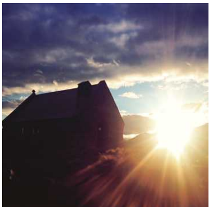
▲朝日を浴びる「善き羊飼いの教会」