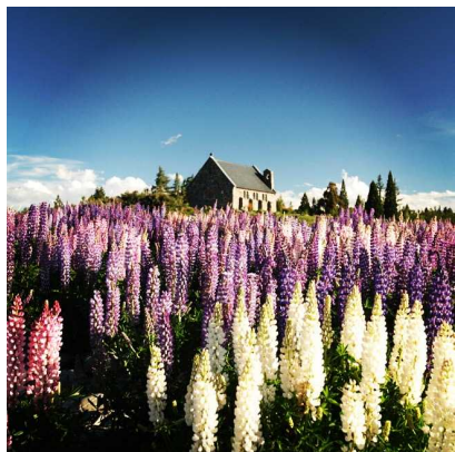
▲11月下旬～12月上旬にはルピナスの花が満開に