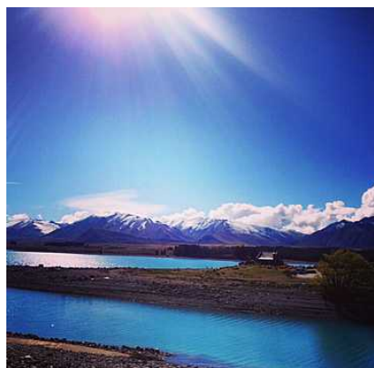
▲ミルキーブルーに輝くテカポ湖

■ニュージーランド航空 ～ニュージーランド国内も充実のネットワーク！国際線と国内線を運航するニュージーランドのフラッグキャリア～ ATW 雑誌の「エアライン・オブ・ザ・イヤー」を3年間で2度受賞（世界初）しました（2010年・2012年受賞）。