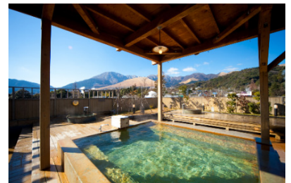
別府温泉 おにやまホテル 露天風呂（イメージ）