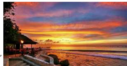
(バリ島 サンセットタイムイメージ)

「サンセットが見えるレストラン」でも、サンセットが見える“時間”と“お席”じゃないと意味がない。ハネムーンパンフレット掲載コースでは、レストランはもちろん、“時間”と“お席”にもこだわりました。例えば、バリ島のアヤナ・リゾート スパ バリ内の人気絶景レストラン“キシック・シーフード・バー＆グリル”では、こちらのレストランで一番人気のある“海に向かって配置された最前列 1 1 席のうちのいずれかのお席をサンセットタイム”にご用意いたします。事前予約は一切できませんので、このお席を事前予約できるのは H.I.S. だけとなります。「ステキなレストランで予約したにも関わらず座った席が奥側・・・」ハネムーン先輩からの声を反映し、一生のステキな思い出となるハネムーンにさせていただくために企画担当がおすすめするレストランで、こだわりのスペシャルシートをご用意し、「2 人だけの特別な時間」をご提供します。その他、国際線での並び席、ダブルベッドやバスタブ付きのお部屋など、『未広がりの最大 8 つのポイント』として用意しております。さらに、H.I.S. でお二人で総額 60 万円以上の旅行商品をご契約いただくと、ご旅行中も、帰国後もご使用いただける「ランドリーネットセット」「ハレイワハッピーマーケット×H.I.S. トラベルサブバッグ」、「La CASTA のトラベルキット」のいずれかをプレゼントいたします。