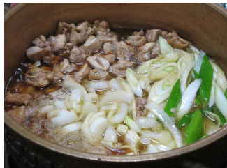
(ちゃんこ鍋 イメージ)