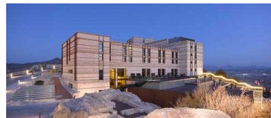
パドール外観（イメージ）

★H.I.S.バルセロナ・マドリッド支店が日本語で24時間安心サポート致します！