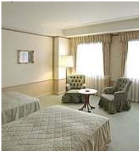
(スタンダードルーム イメージ)