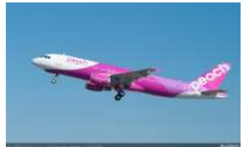
(ピーチ・アビエーション イメージ)

H.I.S.では今夏よりピーチ・アビエーションが就航する、札幌線やソウル線を利用した旅行商品も予定しております。LCCならではの低価格を生かし、お客様にとってよりリーズナブルかつ内容充実の企画商品を展開してまいります。