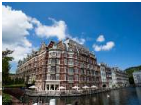
(ホテルヨーロッパ)

ハウステンボスでは、2012年7月29日(日)~10月28日(日)まで『幻のゴッホ展 -パリ時代のゴッホ、空白の2年間- Van Gogh in Paris : New Perspectives』を開催いたします。展示はゴッホばかりの作品、新たな研究によりゴッホの弟テオを描いたと判明した作品を含め日本初公開が36作品、史上初のゴッホの自画像8点出品と比類なく珍しい博覧会です。