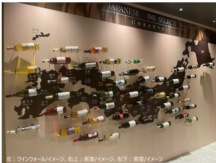
左：ワインウォール/イメージ、右上：客室/イメージ、右下：客室/イメージ

H.I.S.ホテルホールディングス株式会社（本社：東京都港区）が運営する、ウォーターマークホテル京都と変なホテル 奈良は10月1日（日）でオープン3周年を迎えました。そこで、ウォーターマークホテル京都では、日本初、日本全国47都道府県のご当地ワインをご用意した「ワインルーム」を10月5日（木）より発売し、変なホテル 奈良では、宿泊券などが当たる3周年記念イベントを10月9日（月）～10月31日（火）の平日に毎日実施いたします。