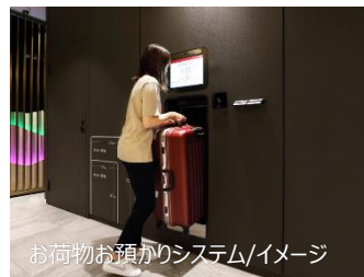
お荷物お預かりシステム/イメージ