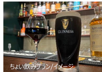
ちよい飲みプラン/イメージ