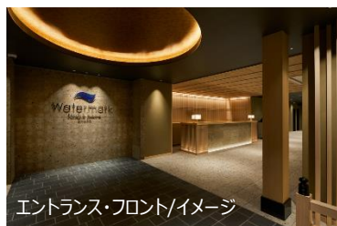
エントランス・フロント/イメージ