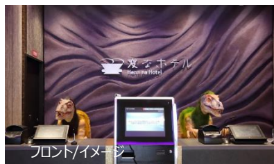
フロント/イメージ

詳細は公式ホームページをご参照ください。 https://www.hennnahotel.com/kyoto-hachijoguchi/