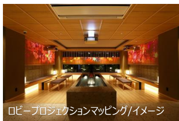
ロビープロジェクションマッピング/イメージ