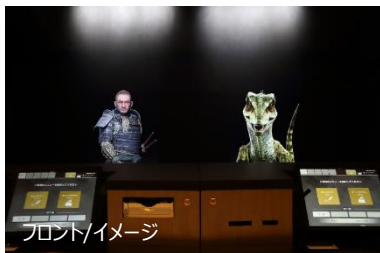
フロント/イメージ

詳細は公式ホームページをご参照ください。 https://www.hennnahotel.com/nara/