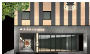
△エントランス（イメージ）

H.H.H.は、新型コロナウイルス感染症対策として、これまでのロボットによる非接触のフロント対応のみならず、すべての施設の館内や設備・備品に関して入念なアルコール消毒・清掃の実施、手指消毒薬の設置、レストランにおけるバイキング形式から朝食セットメニューへの変更、ホテルスタッフのマスク着用、フロントチェックインカウンターでのソーシャルディスタンス確保のご案内など、ウィズコロナの対応を行っております。これからもお客様に安心してご利用いただけるホテルサービスを提供してまいります。