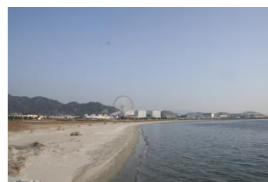
<ラグーナビーチ（大塚海浜緑地）>