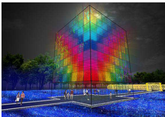
“日本初” 光のキューブ

シャンパンゴールドに包まれる「光の回廊」を抜けると目の前に広がる、一面の青い光が海のように波立つ「光のビッグブルー」。LEDが箱型の中で自由自在に動く、日本初の高さ15mの巨大キューブオブジェ「光のキューブ」も登場。