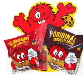
▲ニュージーランドで定番人気のオーガニッククッキー。