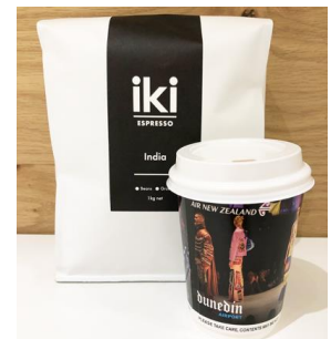
▲コーヒーはニュージーランド航空特別仕様のカップでご提供。