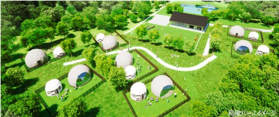
鳥瞰パースイメージ

株式会社エイチ・アイ・エス（本社：東京都港区 以下、HIS）は、北陸初となる、愛犬と一緒に過ごす専用のグランピング施設「GLAMHIDE WITH DOG KOMATSU」（読み方：グランハイド ウィズ ドッグ コマツ）を7月25日（月）よりソフトオープンし、本日より予約受付を開始します。HISがグランピング施設を運営するのは初となります。