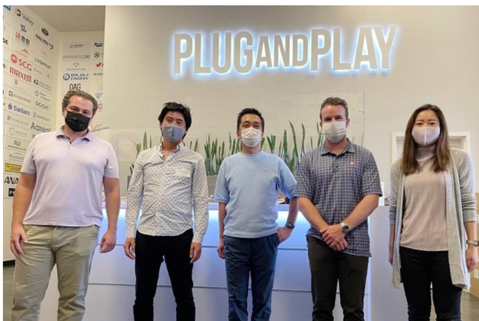
(Plug and Play シリコンバレーと HIS アメリカ法人のメンバー)

HIS アメリカ法人は、2020 年より Plug and Play にコーポレートパートナーとして参画しており、Port Remote Pte. Ltd. (本社：シンガポール https://www.theportapp.com/ )、CHOOOSE™ (本社：ノルウェー オスロ https://choose.today/ ) との業務提携・投資を行ってまいりました。これらの実績と、コロナ禍において旅行業界が困難な状況の中、サステナブルツーリズムを推進する新ブランドの旅行予約サイト「Copollo」を立ち上げたこと、投資機会を探索する視野を持ち続けていることが評価され、受賞いただきました。