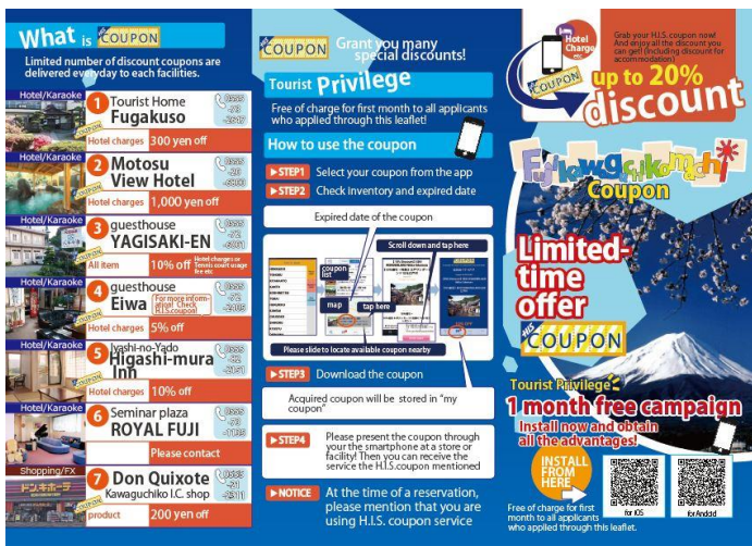
【「富士河口湖タイムセール」パンフレット】