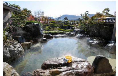
阿蘇内牧温泉 阿蘇プラザホテル（イメージ）

■対象商品 URL： http://www.his-j.com/kokunai/kanto/tour_info/kyushu/fukko/