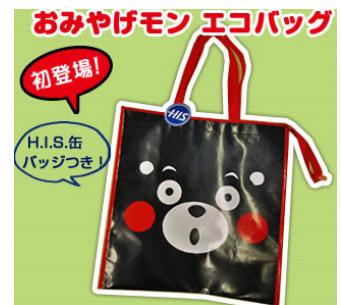
おみやげモン エコバック（イメージ）

・水前寺観光センター ・熊本ワイン（フードパル熊本内） ・三愛レストハウス ・大津 キムチの里 ・はな阿蘇美 ・高森田楽の里