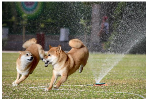
▲画像はイメージです

本イベントは、愛犬と一緒に夜のラグーナテンボスをお楽しみいただけるイベントです。期間中はアトラクションやラグナシア園内各所で煌めくイルミネーションなど、ラグナシアならではのイベントを楽しめます。また、巨大な人工芝のドッグランにはスプリンクラーを設置し、水を浴びながら運動したり、トリックアートを楽しめたりと、ラグナシアやフェスティバルマーケットの各施設を愛犬や愛猫と一緒に利用できます。