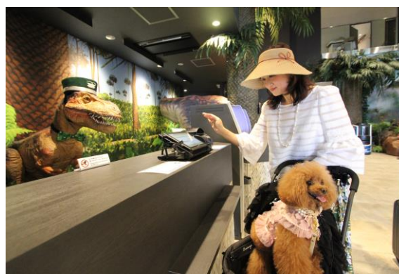
▲変なホテル「ドッグルーム」