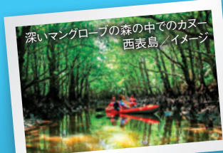
深いマングローブの森の中でのカヌー 西表島/イメージ

3つの中から好きなアクティビティを選択可能。カヌーに乗ってマングローブの森を探索する「マングローブカヌーツアー」や大自然の中をトレッキング「リトリート滝トレッキングツアー」、溪流を下りながら森林浴を楽しむ「リトリートキャニオニングツアー(7月出発のみ)」など沖縄の大自然を堪能。