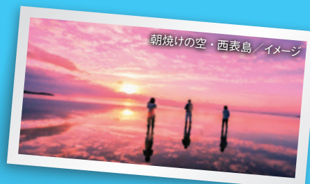
朝焼けの空・西表島/イメージ