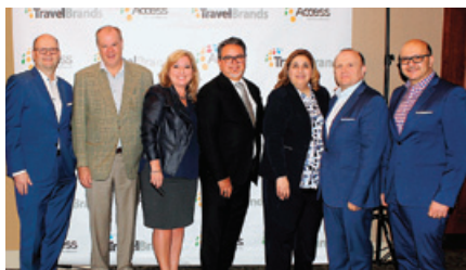
Red Label Vacations幹部メンバー