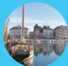
オンフルール /イメージ

249,800円~429,800円(税込) 7~10月出発:一例/お1人様/大人2・3名1室利用/燃油サーチャージ別途必要