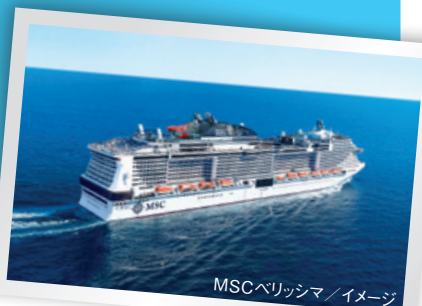
MSCベリッシマ/イメージ

石垣島・宮古島など、この時期人気の寄港地を効率よく巡ります。また台北からでは交通が不便な花蓮へも寄港するため、何度も台湾へ行ったことのある方にもおすすめです。