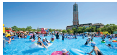
〔「水の王国」イメージ〕

今年も「水の王国」が7月6日から開幕します。ロングスライダーをはじめ、海上ウォーターパークなど3大ウォーターパークが登場。7月13日からは「鈴木敏夫とジブリ展」も開催し、スペシャル大花火など、この夏も見どころ満載です。