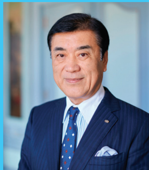
代表取締役会長兼社長 社長執行役員 (CEO)

H.I.S.は、私たちにできる変化をひとつひとつ紡いできました。そして、その思いは、今後も変わりありません。