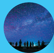
星空観賞・西表島/イメージ

星空保護区国際認定地での星空観賞または月光浴観賞と早朝日の出のリトリートツアーへ。天候に恵まれれば、まるで鏡の上に立っているような絶景に出会えます。