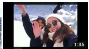
タビジョレポーター in ヨーロッパ(イギリス・フランス) 1:35