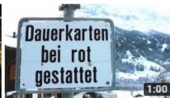
タビジョレポーター in ヨーロッパ(イギリス・フランス) 1:00