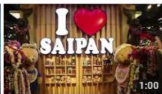
タビジョレポーター in サイパン (@taaaa_chan24さん) 1:00