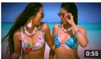
タビジョレポーター in サイパン (@mimi__1121さん) 0:55