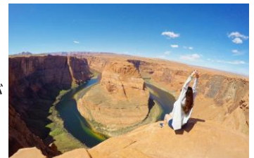
▲ホースシューベンド(イメージ)

今後も各方面で投票キャンペーンを実施し、ランキング結果から、その地の新たな魅力をお伝えすることで、新しい旅先のご提案に繋がればと考えております。