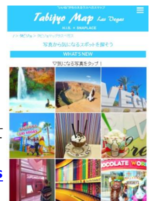
▲タビジヨマップ ラスベガス(イメージ)

※Tabijyo (タビジヨ) とは H.I.S. が運用する、旅する女子のための Instagram アカウント