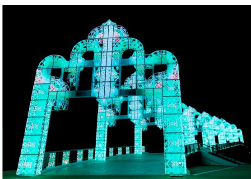
▲100万球のイルミネーションアーチ「幸運のレインボーアーチ」