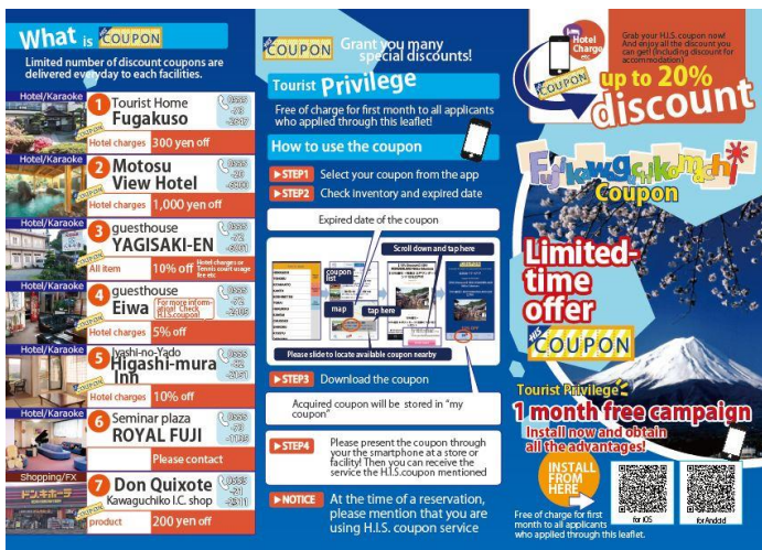
【「富士河口湖タイムセール」パンフレット】