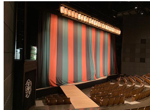
▲歌舞伎鑑賞（新国立劇場）