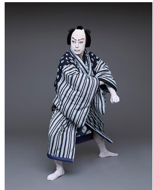
▲尾上菊之助（毛谷村六助） 初春歌舞伎公演「通し狂言 彦山権現誓助剣」