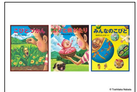
▲顔出しパネル イメージ