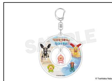
▲こびとづかんゆらゆらアクリルキーホルダー 1,320 円 (税込)