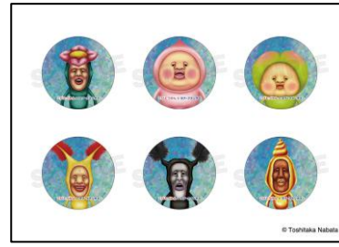
▲こびとづかんトレーディングホログラム缶バッジ (全 6 種類ランダム) 660 円 (税込)