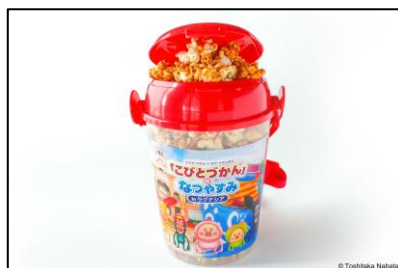
▲こびとづかんポップコーン 1,700円（税込）