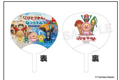
▲前売特典 ミニうちわ

※利用日によって料金変動します。詳細は公式サイトをご確認ください。 ※大人は中学生以上、幼児は3歳以上（2歳以下のお子様は保護者同伴で無料）です。 ※前売特典はチケット購入枚数分のお渡しとなります。