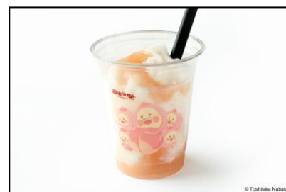
▲カクレモモジリのモモスムージー 800円（税込）