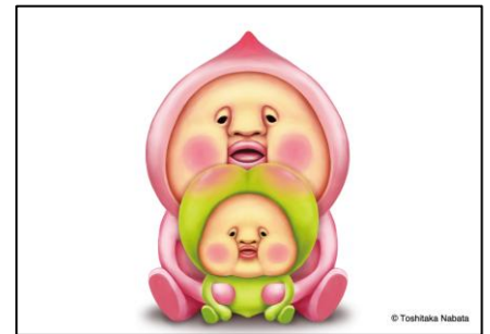
▲フォトパネル イメージ