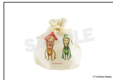
▲こびとづかん サテンフリルポーチ巾着 1,650 円 (税込)