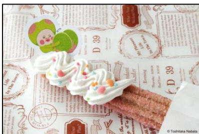
▲スモモノウチのスモモチュリトス 800円（税込）