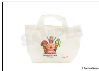
▲こびとづかんランチトート 2,420 円 (税込)