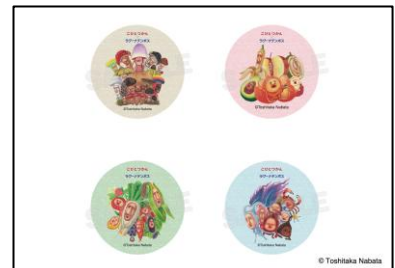
▲注文特典ステッカー （全4種ランダム）