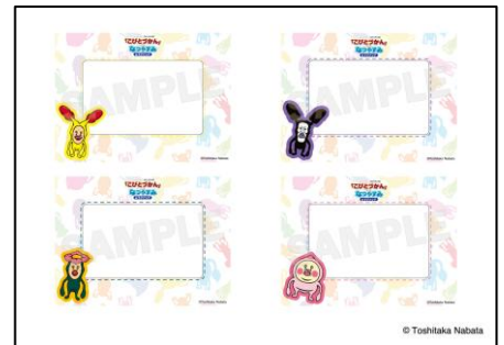
▲イベント限定ペーパーフォトフレーム （全4種ランダム）