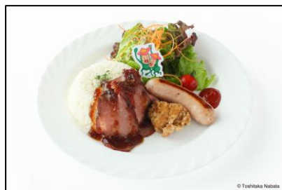
▲リトルハナガシラのお肉プレート 1,700円（税込）

園内のレストランでは、「こびとづかん」や「コビト」をイメージしたラグナシアオリジナルのコラボメニューを提供します。コラボメニューを1点注文につき1枚、ステッカーをプレゼントします。（全4種ランダム）