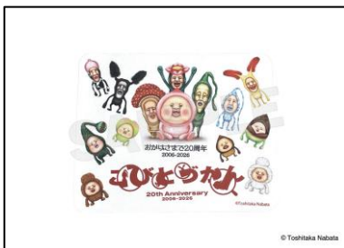
▲こびとづかんマウスパッド 2,200 円 (税込)