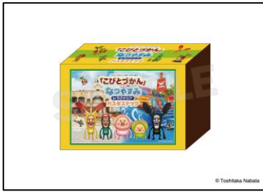
▲こびとづかんパスタスナック (食品) 1,512 円 (税込)

園内に「こびとづかんグッズショップ」がオープンします。ショップでは、ここでしか手に入らないラグーナテンボス限定のオリジナルグッズやオフィシャルグッズなどを多数販売します。