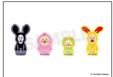
▲イベント限定ダイカットステッカー （全4種ランダム）