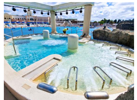
▲温水ジャグジー「セイレーンの泉」