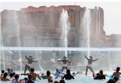
▲ショーキャストと一緒にダンス 「スプラッシュビクス」