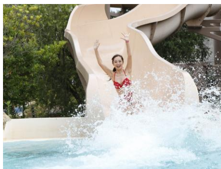
▲ウォータースライダー「ゼウスの稲妻」