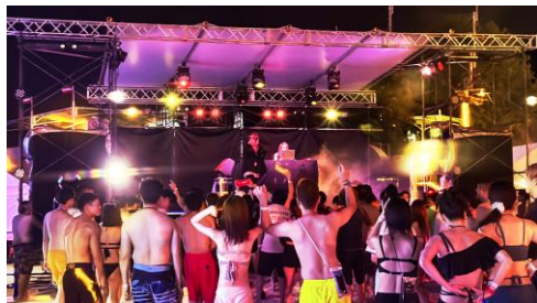
▲DJの音楽と大量の泡に包み込まれる 「ラグーナプールパーティ 2026」