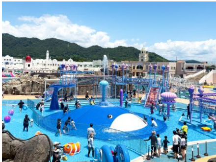
▲海の生き物をモチーフとした様々な仕掛けがあるキッズプールエリア「くじらさんのスプラッシュガーデン」

さらに、ラグナシアならではのプールに入りながらダンスや噴水ショーが楽しめるエンターテインメントショーを開催します。