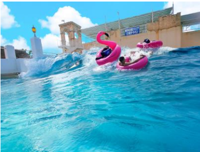
▲最大波高 1m の大波が発生 「大波タイム」