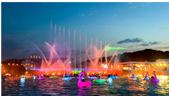
▲エンターテインメントショーを 間近で楽しめるセンタープール 「ルナポルト」