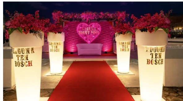
▲写真映え抜群 「フォトスポット」