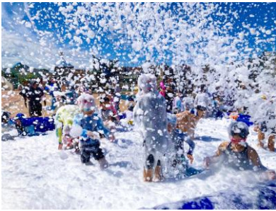
▲キッズに大人気 「あわあわプール」