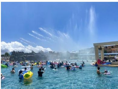
▲噴水ショー 「スプラッシュファウンテン」