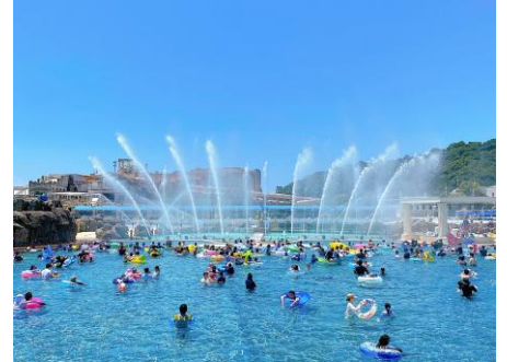
▲エンターテインメントショーを間近で楽しめるセンタープール「ルナポルト」