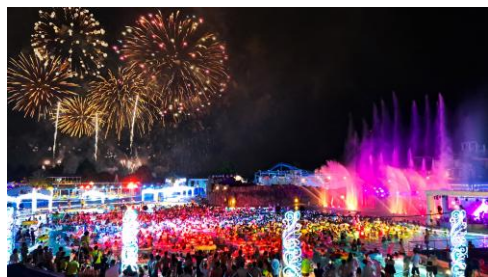
▲打上花火 「スプラッシュ GIGAMAX」