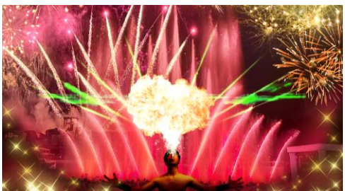
▲花火スペクタキュラ 「FLAME (フレイム)」