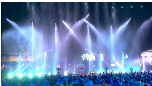
▲「スプラッシュビーツ」