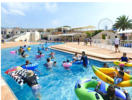
▲全長230mの流れるプール「ウロボロスの河」