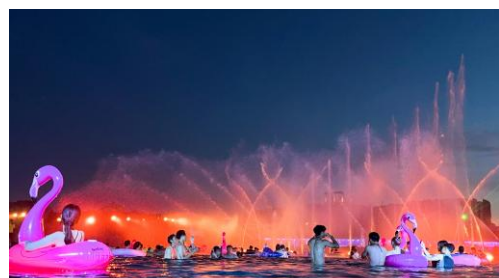
▲「スプラッシュビーツ ファウンテン」