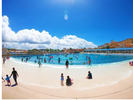
▲日本最大級 最大波高1mの波の出るプール「ジョイアマーレの浜辺」