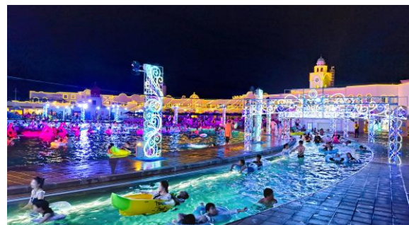
▲イルミネーションドーム「マリンファンタジア」が加わり さらに幻想的な空間になる流れるプール 「ウロボロスの河」