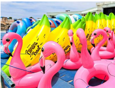
▲種類豊富な浮き輪のレンタル 「浮き輪フリーパス」