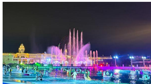
▲大人（13歳以上）限定 ラグジュアリーな空間の波の出るプール 「ジョイアマーレの浜辺」