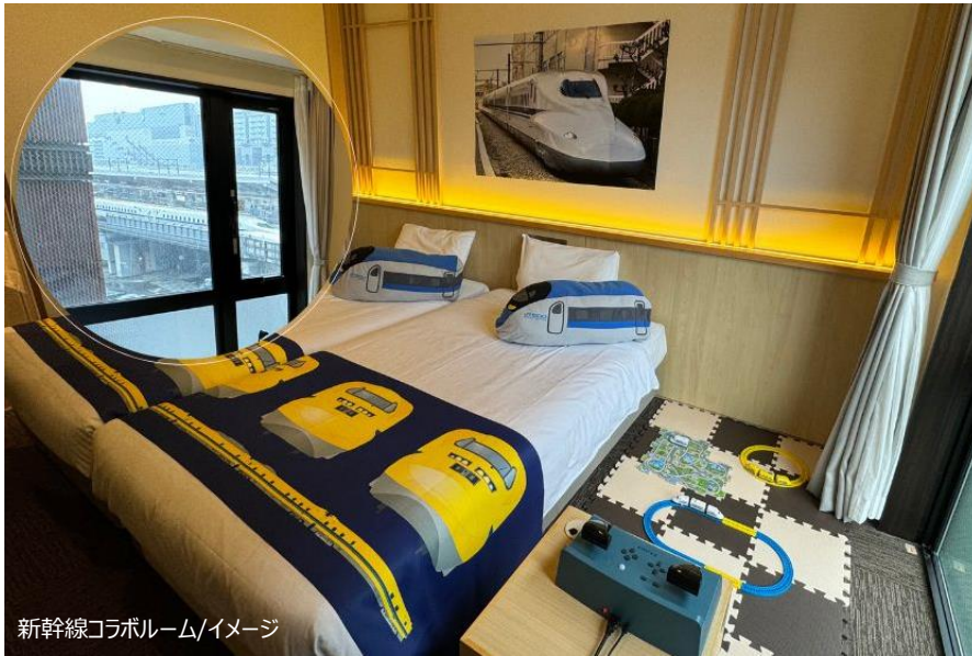
新幹線コラボルーム/イメージ

H.I.S.ホテルホールディングス株式会社（本社：東京都港区）が運営する、変なホテル京都 八条口駅前には、客室を新幹線で装飾した「新幹線コラボルーム」を2月9日（金）より発売します。