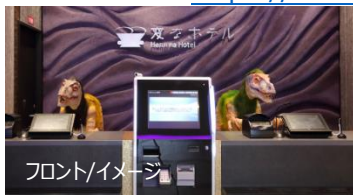
フロント/イメージ

公式ホームページ： https://www.hennnahotel.com/kyoto-hachijoguchi/