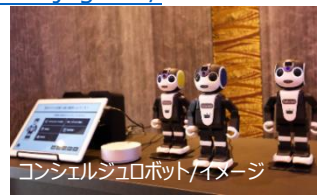
コンシェルジュロボット/イメージ