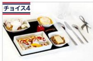
チョイス4 ジャン・アンベールのマルシェ フランス有名若手シェフが考案したメニュー。 通常21ユーロ追加⇒無料 ※パリ⇒東京間のみ

※2017年3月31日までのご予約かつ2017年5月5日東京発～2017年7月13日東京発・パリ発が対象。 ※往路又は復路のどちらかで1回ご選択いただけます。 ※往路・復路で選べるメニューが異なります。 ※一旦リクエストを承ると、メニューの変更はできません。