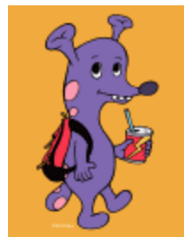
< H.I.S. 学生旅行専用キャラクター >

期間：2006 年 12 月 11 日 (月) ~ 2007 年 1 月 31 日 (水) 限定人数：登録先着 5,000 名様 特典：キャンペーンサイト登録で H.I.S. 学生旅行専用キャラクターのデコメールプレゼント。 クチコミポイントを 10 ポイント獲得された方には、¥1,000 の H.I.S. 割引券をプレゼント。