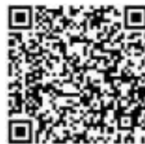
< キャンペーン専用 QR コード >